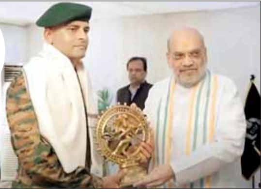
शाह ने कहा कि राष्ट्रीय जांच एजेंसी (एनआई) की फॉरेंसिक टीम ने साबित कर दिया है कि ऑपरेशन महादेव के दौरान मारे गए आतंकवादी वही थे जिन्होंने पहलगाय में नरसंहार को अंजाम दिया था। गृह मंत्री ने कहा, प्रधानमंत्री नरेंद्र मोदी और पूरे देश की ओर से मैं भारतीय नागरिकों के दिलों में सुरक्षा की भावना को मजबूत करने के लिए सुरक्षा बलों को बधाई देता हूँ।