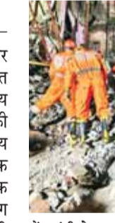
मां और मासूम की मौत, 9 घायल