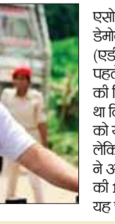
बाइक पर दिखे बहन-भाई